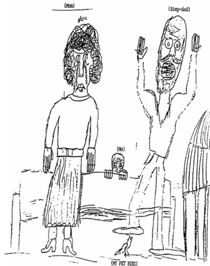
Uit: Ascione, Frank R. Battered women's reports of Their Partners' and Their Children's Cruelty to Animals. 1998

Het onderzoeksrapport "Cirkel van Geweld" wordt onder de aandacht gebracht van het Veiligheidshuis Den Helder, Advies- en Steunpunt Huiselijk Geweld en de huisartsen. De gemeente Den Helder volgt de verrichtingen van de Taskforce en past zo nodig richtlijnen en protocollen aan.